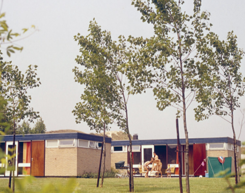
Marie-Puck Broodthaers, Musée - Museum Les Aigles, 1970 (borduursel). Collectie Zeeuws Museum.