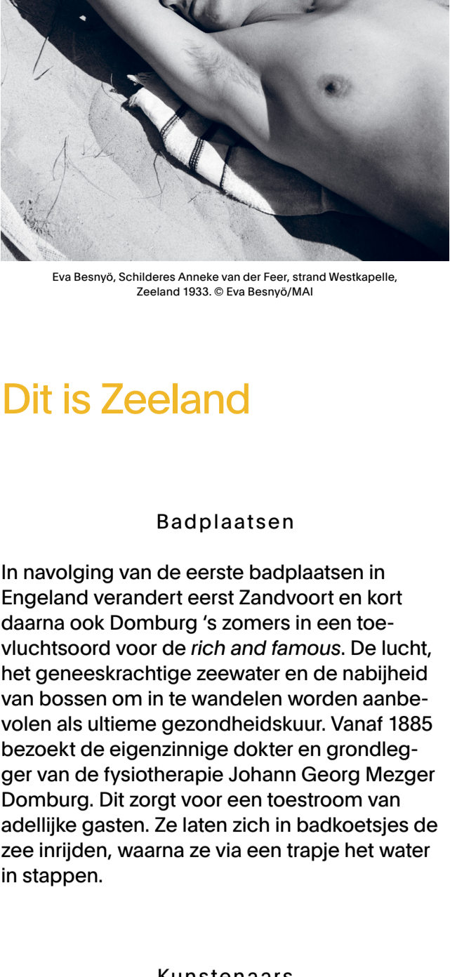
Eva Besnyó, Schilderes Anneke van der Feer, strand Westkapelle, Zeeland 1933.