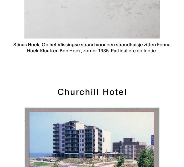
Jaap Scheeren, Noordzee residence, 2017 Collectie Zeeuws Museum

Vanaf de jaren '60 komt het massatoerisme op. Mensen hebben steeds meer vrije tijd. Door de introductie van de 'reisspaarkas' kunnen Nederlanders sparen voor hun vakantie. Al in de jaren '50 komen er ook veel Duitsers in Zeeland vakantie vieren, hoewel ze zich dan vaak voor Zwitsers uitgeven. De oorlog ligt nog te vers in het geheugen. Toerisme wordt een van de belangrijkste bronnen van inkomsten in Zeeland.