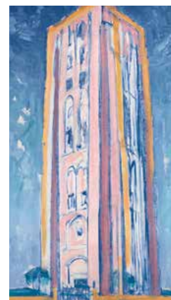
Piet Mondriaan, Vuurtoren Bij Westkapelle, ca. 1910 (olieverf op doek). Collectie Gemeentemuseum Den Haag.

Piet Mondriaan brengt in 1909 de hele zomer in Domburg door. Het is een periode waarin hij zijn manier van werken drastisch wijzigt. Tot 1907 schildert Mondriaan naturalistische landschappen in realistische kleuren. Daarna gaat hij kleuren weergeven zoals hij ze ervaart. De blauwe appelboom is onderdeel van een reeks bomen. Mondriaan behandelt zijn onderwerp hierin voor het eerst als motief; als herhaling van horizontale en verticale lijnen die losstaan van hun omgeving. Net als de reeks vuurtorens van Westkapelle laat de blauwe appelboom Mondriaan's ontwikkeling zien naar een abstracte manier van werken, waar hij later zo bekend mee wordt.