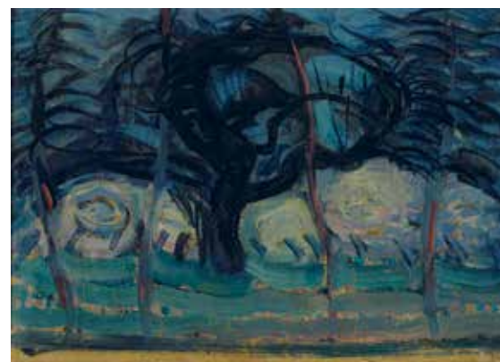
Piet Mondriaan, Blauwe appelboom met golvende lijnen I, ca. 1908 (olieverf op papier). Collectie Zeeuws Museum, aangekocht met steun van Vereniging Rembrandt en Provincie Zeeland.

Naast Domburg trekken ook Westkapelle en Veere aan het begin van de 20e eeuw veel kunstenaars aan.