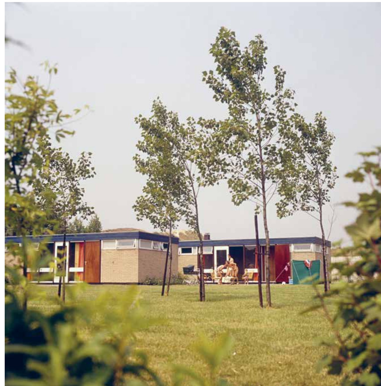
Henk Hilteman, Vakantiebungalows in vakantiepark 't Zeepe', Haamstede, 1971.