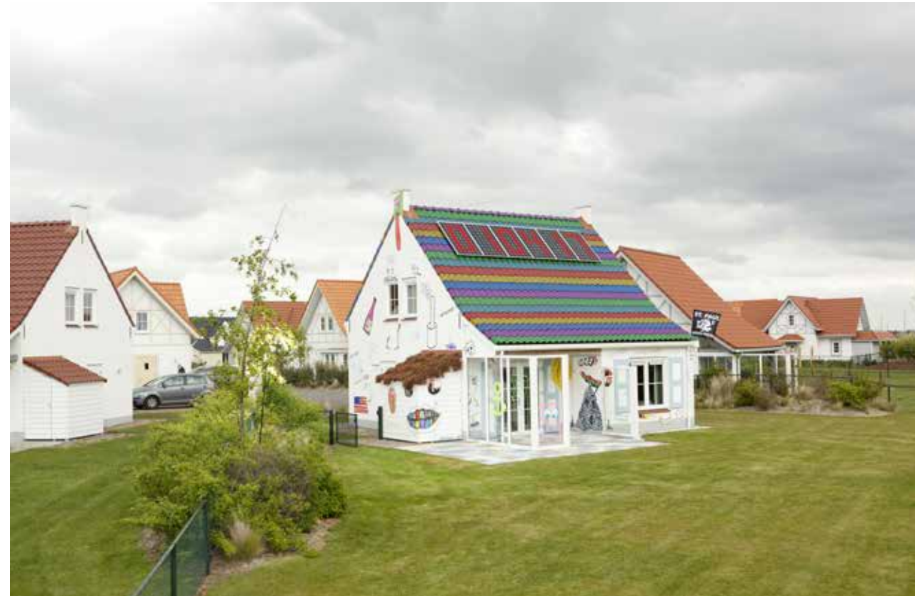
Jaap Scheeren, Noordzee residence, 2017. Collectie Zeeuws Museum