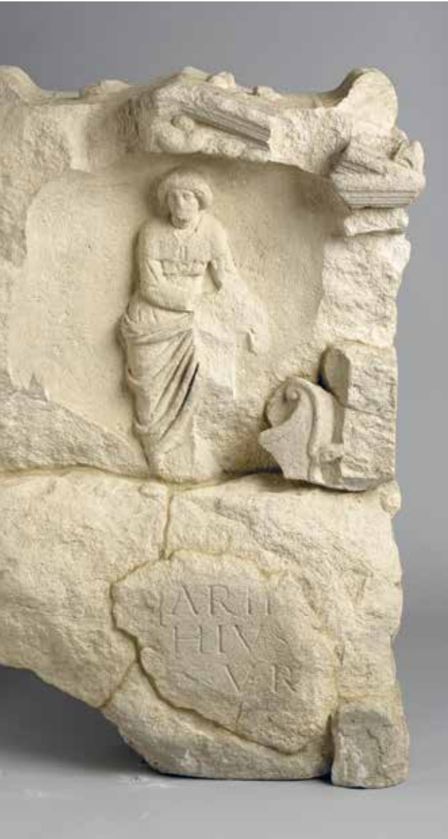
Votiefsteen van de godin Nehalennia geofferd door Ingenunius lanuarus bij de Romeinse tempel bij Domburg, 150-250 n.Chr. (kalksteen). Collectie Zeeuws Genootschap.