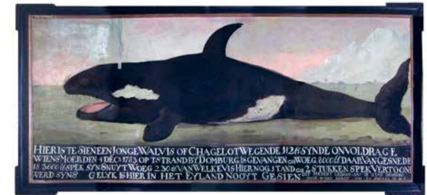
Anoniem, De Orka van Domburg, ca. 1783 (olieverf op doek). Collectie Gemeente Veere.

Met enige regelmaat worden in de Oostere Westerschelde bruinvissen gesignaleerd. Een enkele keer waagt een grotere walvissoort zich in de Zeeuwse wateren. Meestal vertrekken ze weer snel naar de diepere Noordzee, maar soms gaat het mis. Zo strandt op 4 december 1783 een vrouwtjesorka op het strand tussen Domburg en Oostkapelle. Het acht meter lange dier overleeft het niet. De orka wordt geslacht en levert wel 3000 pond spek op. Uit de buik komt een onvoldragen jong tevoorschijn. Deze foetus van 112 pond wordt tentoongesteld in herberg De Oranjeboom in Middelburg.