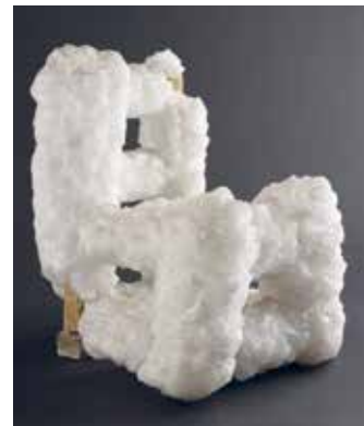
Zoutstoeltje, Curaçao, 1825-1845 (hout, zout). Collectie Zeeuws Genootschap.