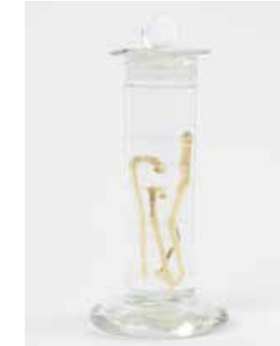
Alcoholrepraat van paalwormen ( Teredo navalis ). Collectie Zeeuws Genootschap.

Vanaf 1730 vormt de paalworm, Teredo navalis , een bedreiging voor schepen, dijken en havenkades. Het langgerekte weekdier vreet zich een weg door alles wat van hout is. Het verzwakt zo de stevigheid van balken en planken. De dieren vormen een ware plaag. Ze zorgen er bijvoorbeeld voor dat de dijken met stenen versterkt moeten worden. De paalworm maakt extra uitgaven voor de kustverdediging noodzakelijk. Overigens zijn verschillende predikanten in die tijd ervan overtuigd dat de paalworm een door god gestuurde straf is voor homoseksualiteit.