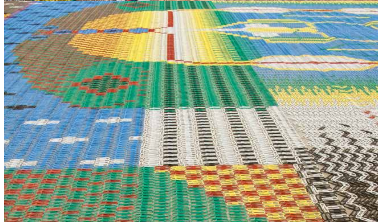
Hook Carpet, 2016, in opdracht van 21_21 Design Sight in Tokyo, Japan.