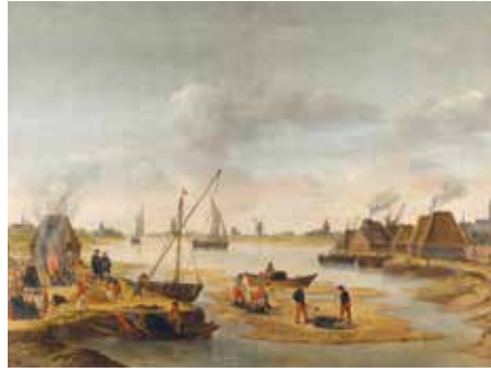
Anoniem, Zoutwinning in Zeeland in de 16e eeuw, 18e/19e eeuw (olieverf op doek). Collectie Zeeuws Genootschap.

Tot de koelkast is uitgevonden, is zout een erg belangrijk middel om bederfelijk voedsel, zoals vlees en vis, te conserveren. De nabijheid van zeewater betekent dat in Zeeland zout kan worden gewonnen. De eerste sporen van zoutwinning in Zeeland komen van een vondst uit de midden ijzertijd (500-200 v.Chr.). In de Romeinse tijd en in de middeleeuwen is het één van de belangrijkste exportproducten van de regio.