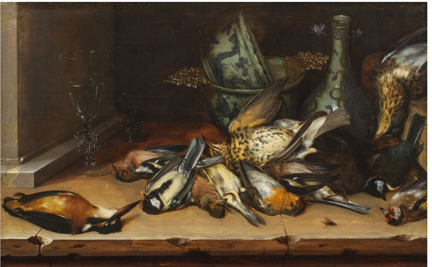
Stilleven door Christoffel van den Berghe