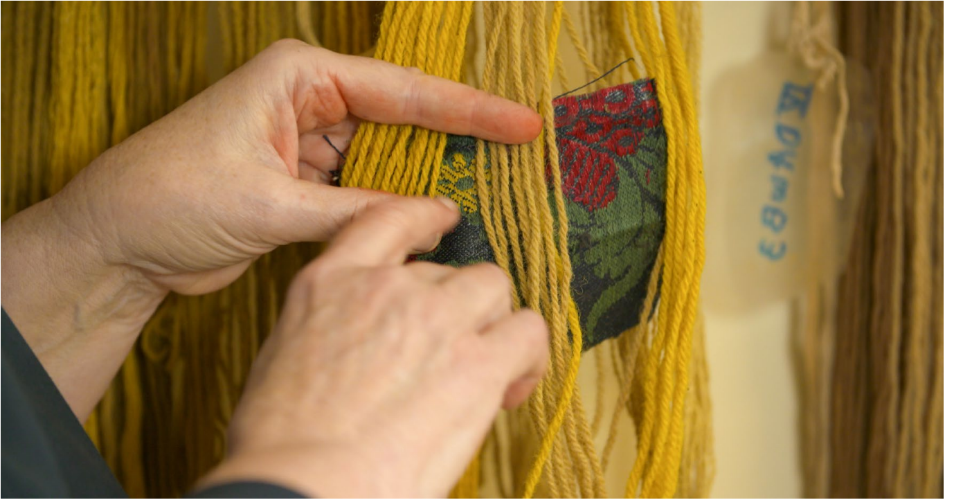
Still Hoekman Brothers